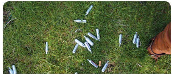
Lachgaspatronen worden vaak achtergelaten op straat. Deze patronen zijn erg belastend voor het milieu door het metaal dat nodig is voor de patronen, maar ook vanwege het broeikaseffect.