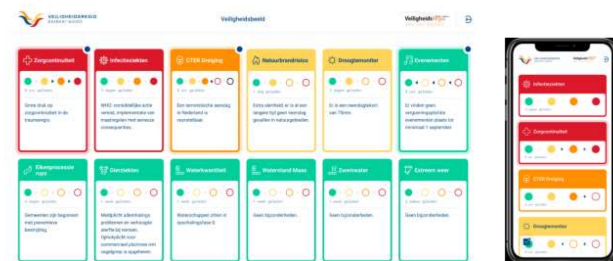
Figuur 1: Voorbeeld actueel veiligheidsbeeld

Bij een daadwerkelijke inzet worden crisisprocessen zodanig ingericht dat bekende en onbekende risico's met wisselende partners kunnen worden bestreden. Dit model stopt in een nieuw crisisplan dat in samenwerking met Veiligheidsregio Brabant-Noord wordt ontwikkeld. Zodra herstel kan beginnen is een zorgvuldige overgang van crisis- naar herstelfase belangrijk; dit vraagt om een regierol van de veiligheidsregio op deze transitie, zoals ook bij de coronacrisis het geval was.